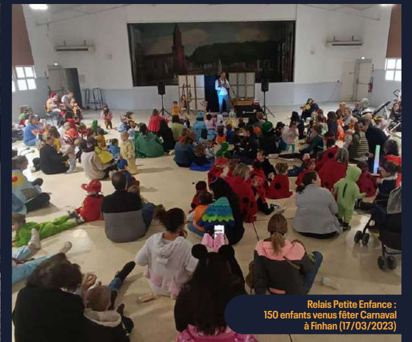
Relais Petite Enfance : 150 enfants venus fêter Carnaval à Finhan (17/03/2023)