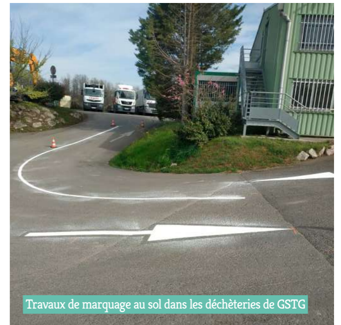
Travaux de marquage au sol dans les déchèteries de GSTG

→ Dans un lieu de passage et largement fréquenté comme peut l'être une déchèterie, il est capital de sécuriser les cheminements piétons, les sens de circulation et le repérage de certaines zones. Dont acte pour les déchèteries de Verdun/Garonne et Dieupentale où un nouveau marquage au sol a été réalisé par le service voirie de la Communauté de communes.