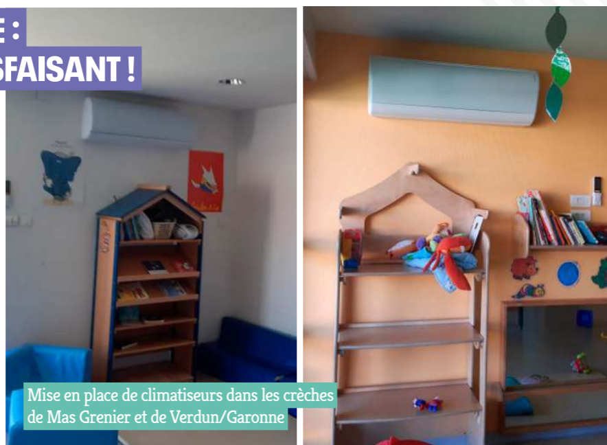
Mise en place de climatiseurs dans les crèches de Mas Grenier et de Verdun/Garonne

→ Entre contraintes environnementales pour réduire les consommations d'énergie et nécessaire confort des enfants et encadrants dans les crèches en période caniculaire, difficile d'apporter une solution satisfaisante ! C'est pourtant ce qu'ont réussi les services techniques et les établissements d'accueil de la petite enfance avec un compromis : équiper chaque crèche d'une pièce refuge climatisée. Ainsi, fin 2022, les crèches de Mas-Grenier et de Verdun/Garonne ont été équipées de climatiseurs. Chaque crèche du territoire dispose ainsi désormais d'une « pièce refuge » pour affronter les fortes chaleurs. Les dortoirs seront équipés de bras-seurs d'air en 2023.