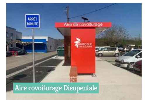
Aire covoiturage Dieupentale