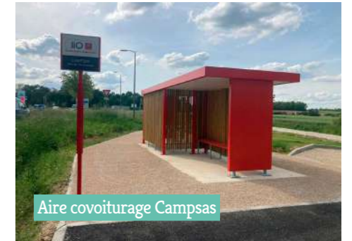
Aire covoiturage Campsas

Changer sa manière de se déplacer, c'est répondre au premier enjeu environnemental du territoire !