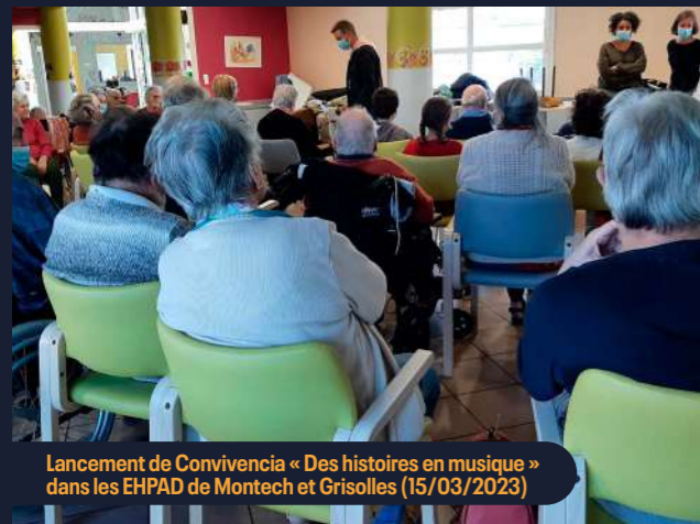
Lancement de Convivencia « Des histoires en musique » dans les EHPAD de Montech et Grisolles (15/03/2023)