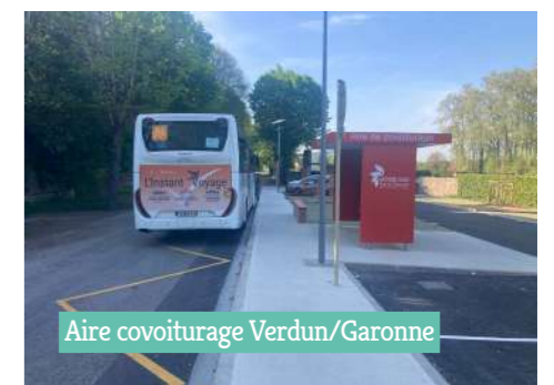
Aire covoiturage Verdun/Garonne