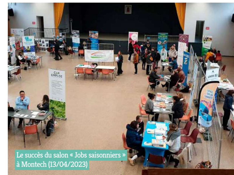
Le succès du salon « Jobs saisonniers » à Montech (13/04/2023)

Outre de trouver un emploi ou une formation, l'accompagnement minutieux que propose le service permet de reprendre confiance, de définir des objectifs professionnels et de se former si besoin. Une démarche personnalisée qui mène à de nombreux succès ●