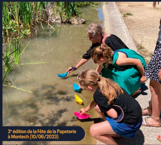
2 e édition de la Fête de la Papeterie à Montech (10/06/2023)