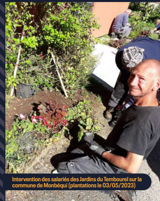
Intervention des salariés des Jardins du Tembourel sur la commune de Monbéqui (plantations le 03/05/2023)