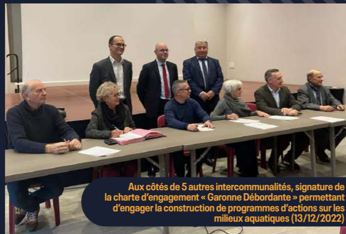
Aux côtés de 5 autres intercommunalités, signature de la charte d'engagement « Garonne Débordante » permettant d'engager la construction de programmes d'actions sur les milieux aquatiques (13/12/2022)