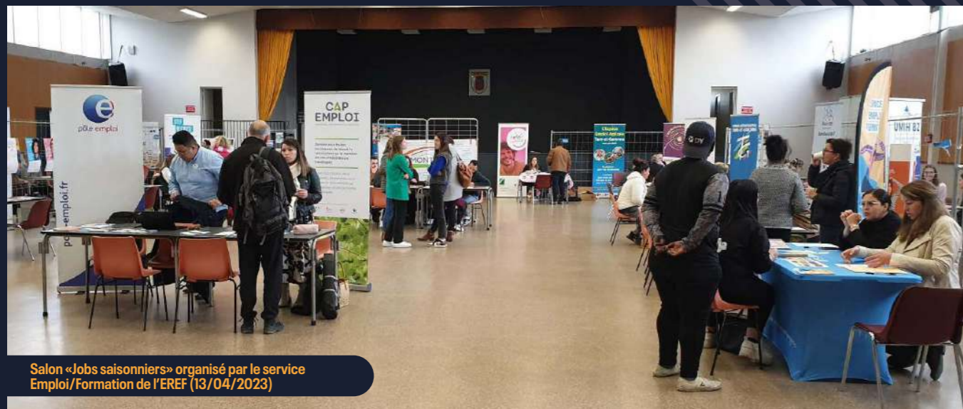
Salon « Jobs saisonniers » organisé par le service Emploi/Formation de l'EREF (13/04/2023)