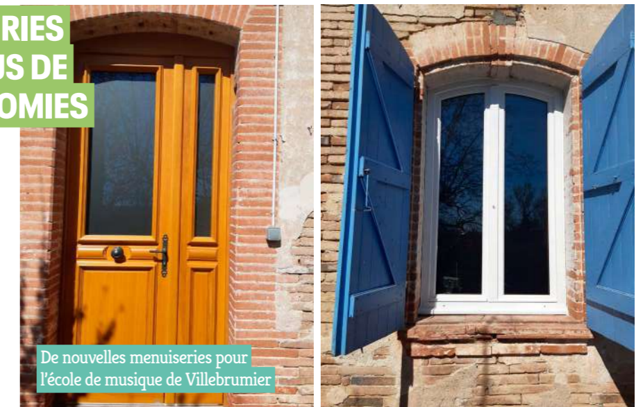
De nouvelles menuiseries pour l'école de musique de Villebrumier

→ En coordination avec la commune, l'ensemble des menuiseries de l'école de musique et de la salle des aînés de Villebrumier ont été remplacées afin d'améliorer le confort thermique des usagers et la performance énergétique du bâtiment. La Communauté de communes est en effet très attentive à la sobriété énergétique. En témoigne son plan de sobriété (voir p.10) qui donnera notamment lieu à la mise en place d'éclairages LED dans les pôles de Labastide-Saint-Pierre et Montech cette année.