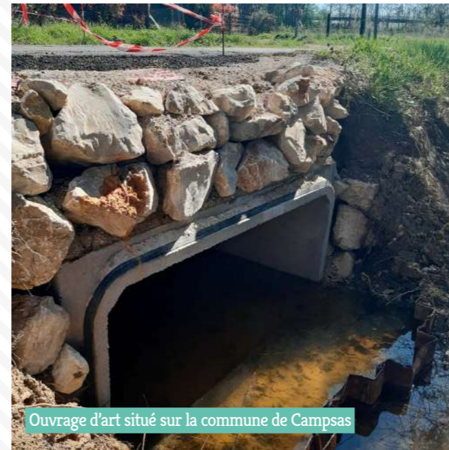
Ouvrage d'art situé sur la commune de Campsas